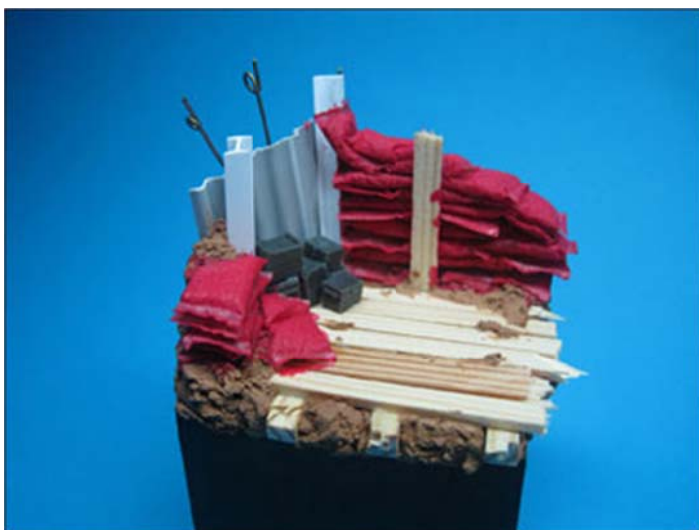
Abbildung/Picture 5: Die fertig fixierten Sandsäcke, fertig zur Grundierung. The fixed sandbags, ready for priming.