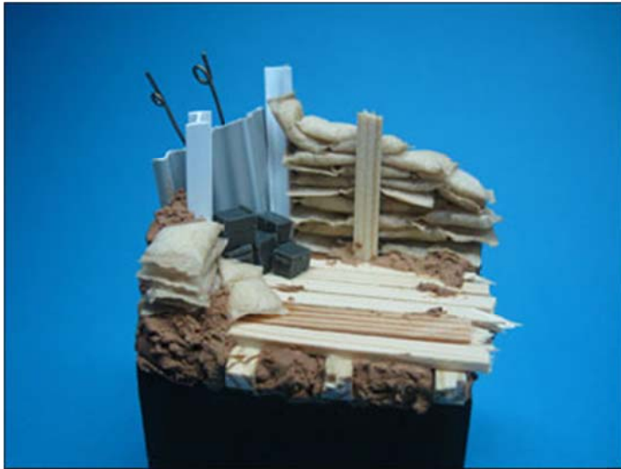
Abbildung/Picture 3: Die fertig positionierten Sandsäcke. The applied sandbags.